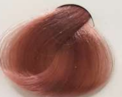
8.16 Light Pearl Blonde بلوند مرواریدی روشن اشقر لولو فاتح