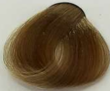
8.7 Light Matt Blonde بلوند زیتونی روشن اشقر زیتونی فاتح