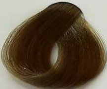
7.7 Medium Matt Blonde بلوند زیتونی متوسط اشقر زیتونی متوسط