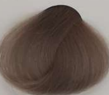
9.9 Extra Light Ash Blonde بلوند خاکستری خیلی روشن انقر رمادی فاتح جداً