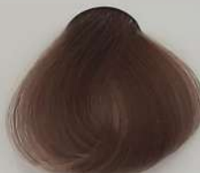
8.1 Light Cendre Blonde بلوند دودی روشن انقر دخالی فاتح