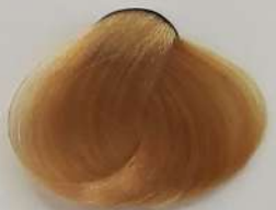
8.3 Light Blonde Gold بلوند طلایی روشن انقر ذهبی فاتح