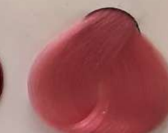
8.620 Barbie Pink صورتی باربی باربیس الوردی