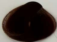
6.81 Dark Nescafe Blonde بلوند نسکافه ای تیره اشقر نسکافه تیره