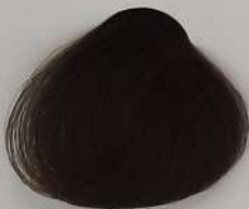
5.9 Light Ash Brown قهوه ای خاکستری روشن بسی رمادی فاتح