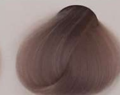
99.92 Poly Chromatic کروماتیک کرم