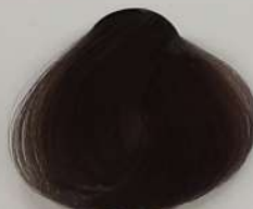
6.1 Dark Cendre Blonde بلوند دودی تیره انقر دخالی غامق