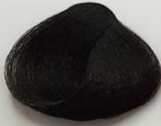
3.0 Dark Brown قهوه ای تیره بسی غامق