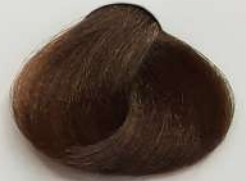
7.0 Medium Blonde بلوند متوسط انقر متوسط