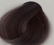
7.12 Medium Purple Cendre Blonde بلوند دودی بنفش متوسط اشقر دخانی بنفش متوسط