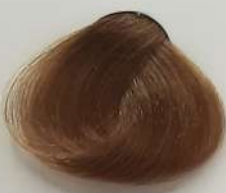
9.0 Extra Light Blonde بلوند خیلی روشن انقر فاتح جداً