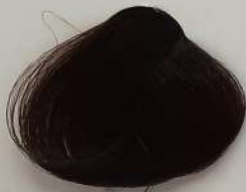
5.00 Extra Light Brown قهوه ای روشن اکسترا بسی فاتح فوق العاده