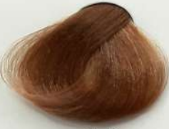
8.8 Milk Chocolate شیر شکللاتی حلیب شکلاتی