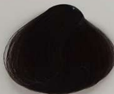
4.1 Dark Cendre Brown قهوه ای دودی تیره بسی دخالی غامق