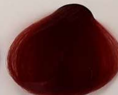
6.660 Fire Red قرمز آتشین اسمر التاری