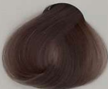
8.192 Sandy شنلی ماسه ای ریل