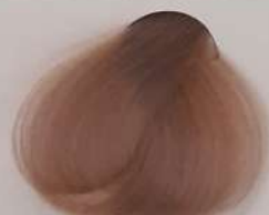
99.32 Champagne شامپانی شامپانی