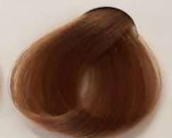
7.38 Biscute بیسکویتی البیسکوت