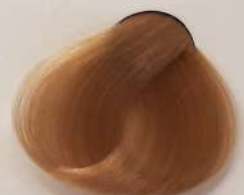
9.316 Honey Butter کره عسلی زنده عسل