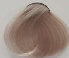
10.1 Platinum Cendre Blonde بلوند دودی پلاتینه انقر دخالی پلاتینی