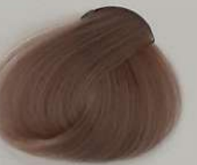
8.019 Pastel پاستل پاستل