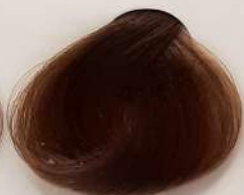
6.82 Cocoa کاکائویی الکاکا