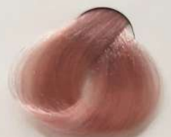
9.16 Extra Light Pearl Blonde بلوند مرواریدی خیلی روشن اشقر لولو فاتح جداً