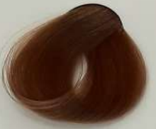
9.81 Extra Light Milk Nescafe Blonde بلوند شیر نسکافه ای خیلی روشن اشقر حلیب نسکافه فاتح جدا