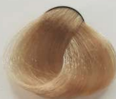
10.0 Platinum Blonde بلوند پلاتینه انقر پلاتینی