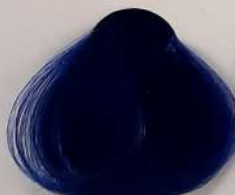
6.101 Cobalt Blue آبی کبالتی الارزق الکوبالت