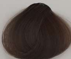
7.9 Medium Ash Blonde بلوند خاکستری متوسط انقر رمادی متوسط