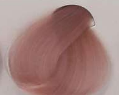
99.16 Pearly مرواریدی لولا