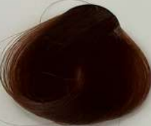
8.81 Light Milk Nescafe Blonde بلوند شیر نسکافه ای روشن اشقر حلیب نسکافه فاتح