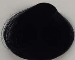
1.1 Carbon Black کربن بلک اسود کربون