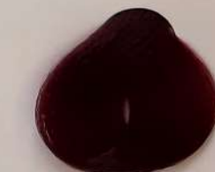
7.262 Raspberry تمشکی الغوت