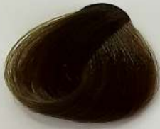
6.7 Dark Matt Blonde بلوند زیتونی تیره اشقر زیتونی تیره