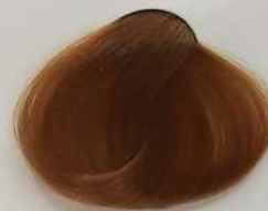
7.3 Medium Blonde Gold بلوند طلایی متوسط انقر ذهبی متوسط