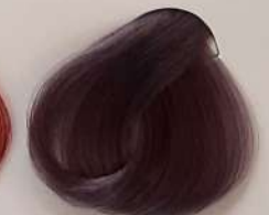
8.212 Lavender لوندر الغراس