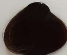
6.00 Extra Dark Blonde بلوند تیره اکسترا انقر غامق فوق العاده