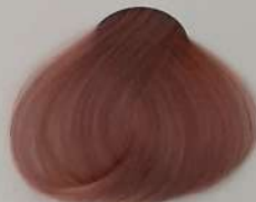
8.063 Rose Gold رزگلد رزگلد