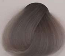
99.11 Crystal Ice یخی کریستالی جلد بلوری