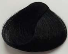
1.0 Black مشکی اسود