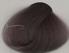
7.190 Dolphin دلفینی دلفین