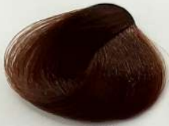
6.8 Dark Chocolate Blonde بلوند شکللاتی تیره اشقر شکلاته تیره