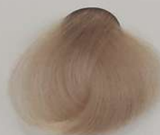
10.9 Silver Ash Blonde بلوند خاکستری نقره ای انقر رمادی الفمه