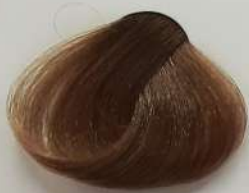
8.0 Light Blonde بلوند روشن انقر فاتح