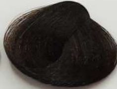
4.0 Medium Brown قهوه ای متوسط بسی متوسط