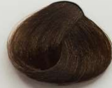
6.0 Dark Blonde بلوند تیره انقر غامق