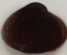
7.00 Extra Medium Blonde بلوند متوسط اکسترا انقر متوسط فوق العاده