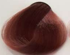
6.16 Dark Pearl Blonde بلوند مرواریدی تیره اشقر لولو تیره