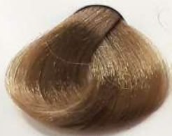
7.31 Medium Beige Blonde بلوند بژ متوسط اشقر بیجی متوسط