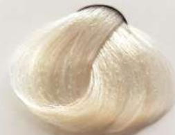
0.00 Bleaching Cream روشن کننده محار