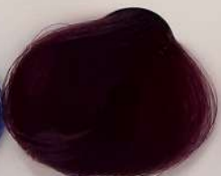
7.221 Wild Orchid ارکیده وحشی ارکیده وحشی