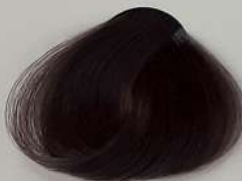
6.12 Dark Purple Cendre Blonde بلوند دودی بنفش تیره اشقر دخانی بنفش غامق