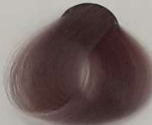
8.12 Light Purple Cendre Blonde بلوند دودی بنفش روشن اشقر دخانی بنفش فاتح