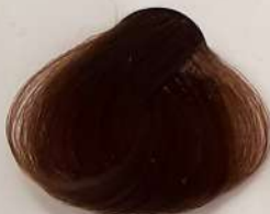
5.815 Mocha موکا موکا