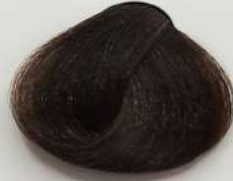
5.0 Light Brown قهوه ای روشن بسی فاتح