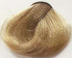
9.31 Extra Light Beige Blonde بلوند بژ خیلی روشن اشقر بیجی فاتح جداً